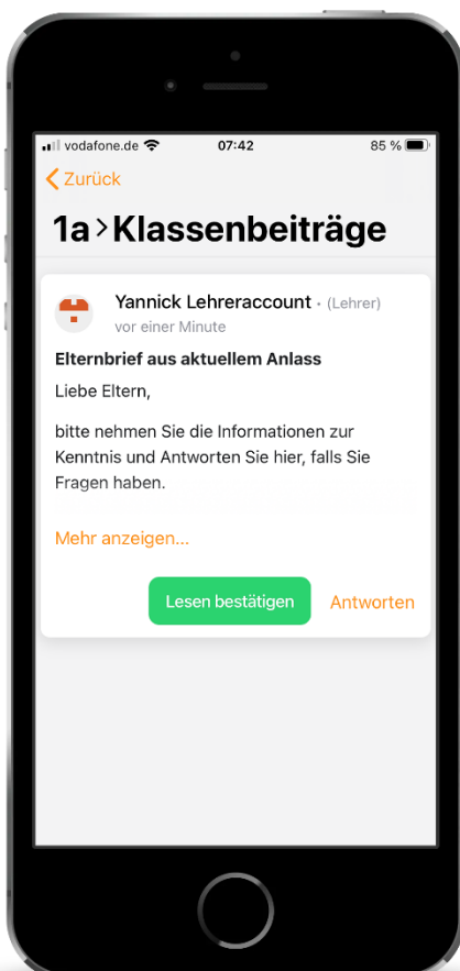
Elternbriefe lesen und bestätigen

Nachdem Sie sich eingeloggt und Ihr persönliches Passwort vergeben haben können Sie: