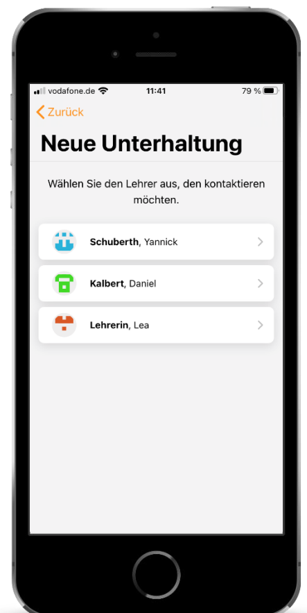
Private Unterhaltungen mit Lehrkräften starten